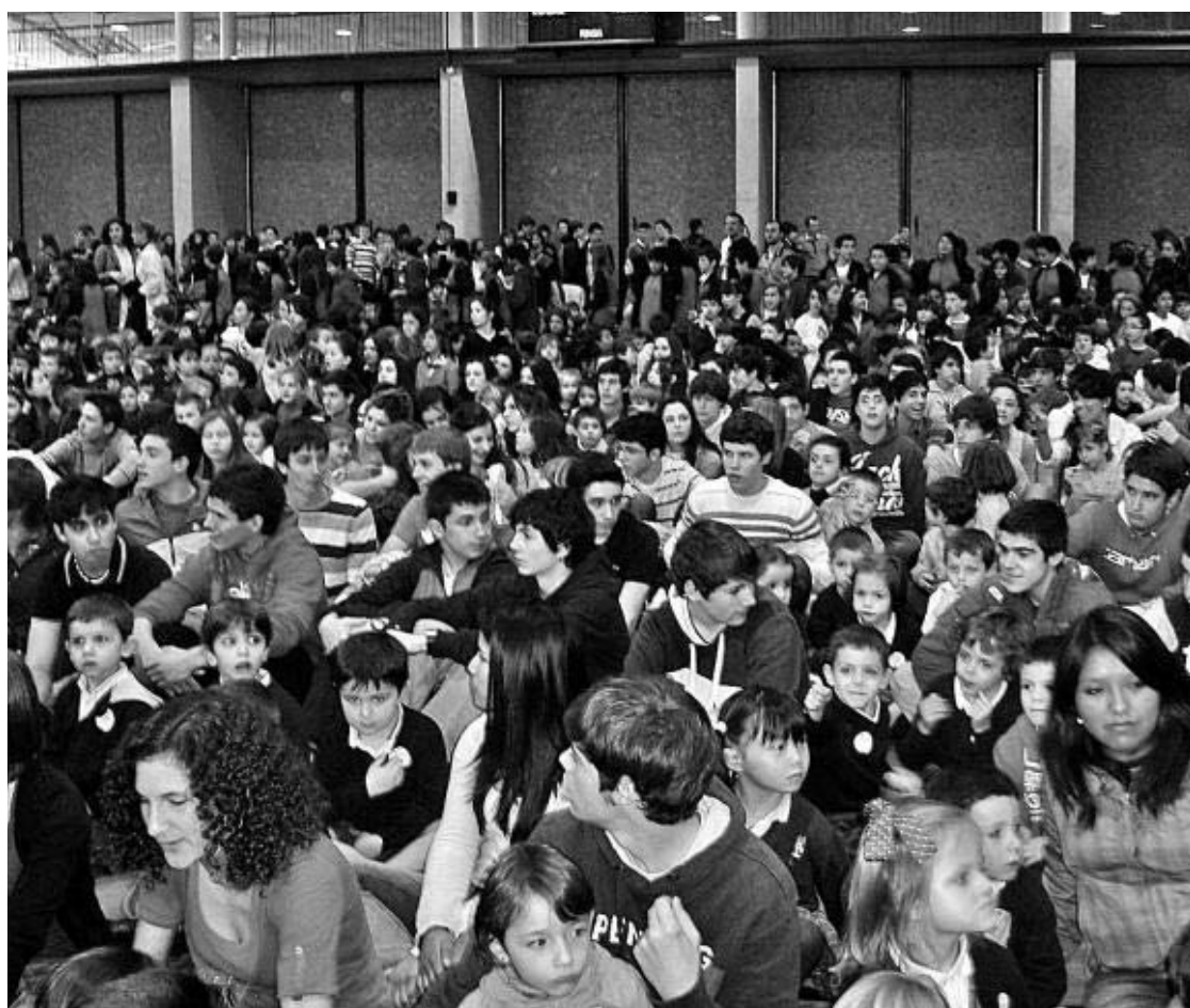
Alumnos de todos los cursos, en un acto de la Semana mundial de la educación , en el polideportivo CEDIDA